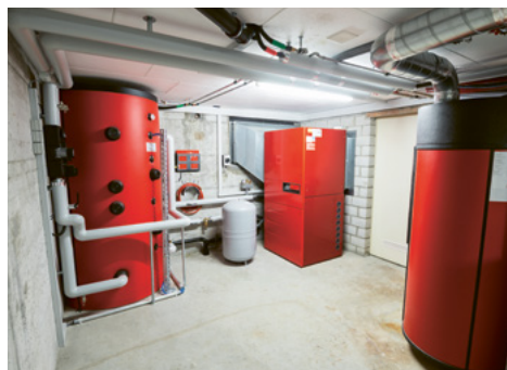
Un chauffage fonctionnant à partir d'énergies renouvelables réduit les émissions de CO 2 à un seuil proche de zéro.