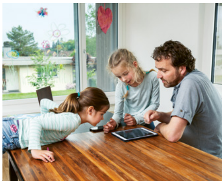
Les installations techniques modernes peuvent être contrôlées à l'aide d'une tablette.