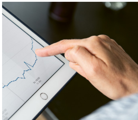
Plus de confort grâce à un assainissement énergétique.

Le Programme Bâtiments contribue à réduire les émissions de CO 2 par le renouvellement énergétique du parc immobilier suisse. Il soutient les propriétaires dans la mise en œuvre de mesures énergétiques et climatiques, dont l'isolation thermique de l'enveloppe du bâtiment, le remplacement de chauffages fonctionnant aux énergies fossiles ou à l'électricité par des systèmes de chauffage recourant aux énergies renouvelables, le raccordement à un réseau de chaleur, les assainissements énergétiques complets de bâtiments existants et les nouvelles constructions répondant aux exigences du label Minergie-P ou CECB A/A.