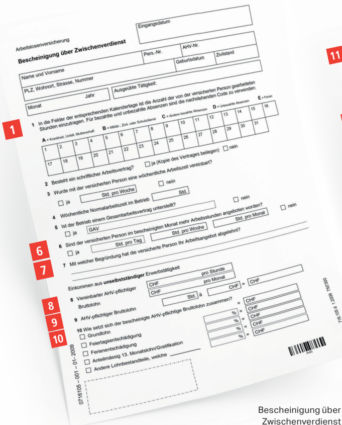
Bescheinigung über Zwischenverdienst Vorderseite

Die Gründe einer Kündigung müssen genauestens formuliert werden.