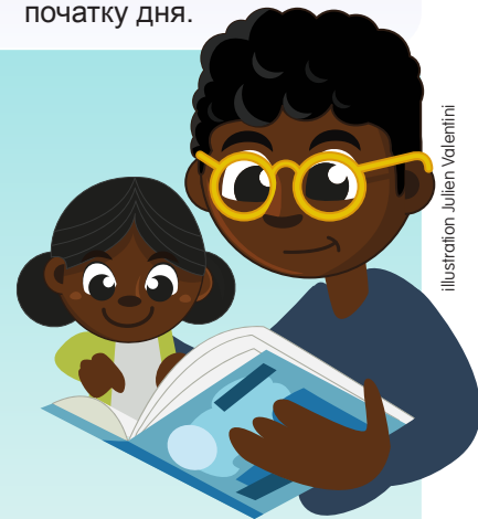
Illustration: Julien Valentini