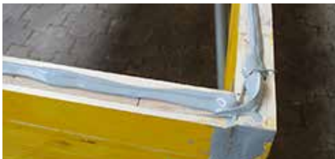
4. Vor der Montage des Bodenteils die Rahmenunterseite mit Klebstoff versehen. Appliquer de la colle sur le dessous du cadre avant le montage du fond. Applicare la colla sul lato inferiore del telaio prima di montare la parte inferiore.