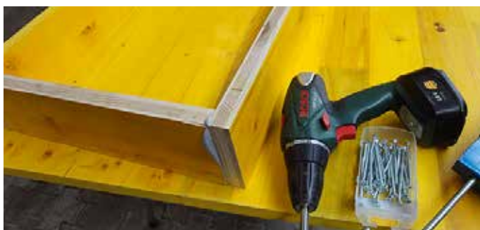
3. Verklebter Rahmen verschrauben. Visser le cadre collé. Avvitare il telaio incollato.