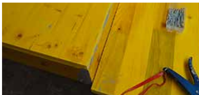
5. Aufgeklebter Boden vor Verschraubung. Fond collé avant la pose des vis. Fondo della vasca incollato prima di avvitare le viti.