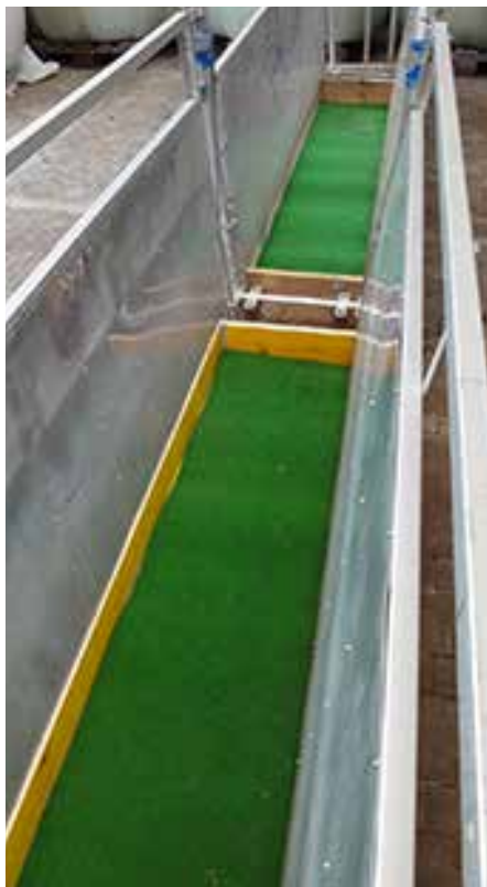
Klauenbad mit zwei Wannen à 2 Meter und seitlicher Abschränkung nach eigener Wahl.

Im Herbst, nach der Alpabfahrt, treten immer wieder Moderhinke-krankte Tiere auf. Neben dem sorgfältigen Klauenschnitt ist das Klauenbad ein wichtiges Instrument zur Behandlung dieser Tiere. Auch für Tiere aus Herden ohne Moderhinke, die im Herbst Schafschauen