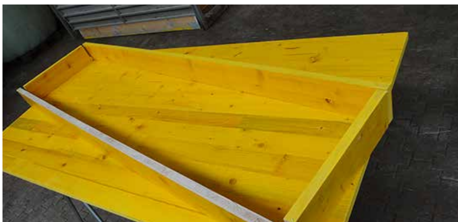
1. Rahmen nicht verbunden. Cadre avant la fixation. Telaio non collegato.