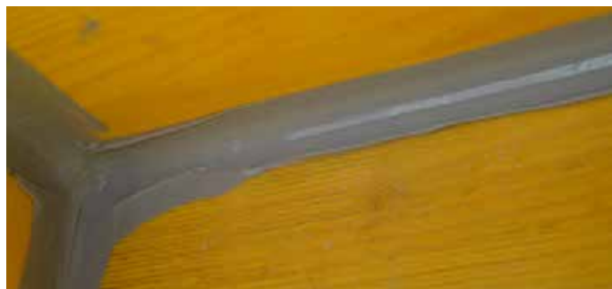
6. Ausstreichen/Abglätten des hervorquellenden Klebstoffs mit Flüssigseife am Finger. Etendre/égaliser la colle dépassant après s'être enduit les doigts de savon liquide. Spalmare la colla che fuoriesce dalle giunture e lisciarla con il dito protetto con sapone liquido.