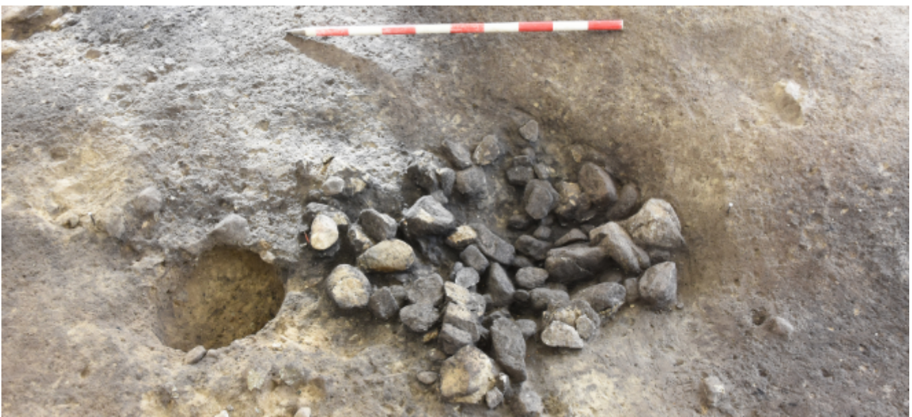
Cette accumulation de pierres brûlées constitue un foyer aménagé par un groupe de chasseurs-cueilleurs sur le site archéologique de Naters-Breiten.