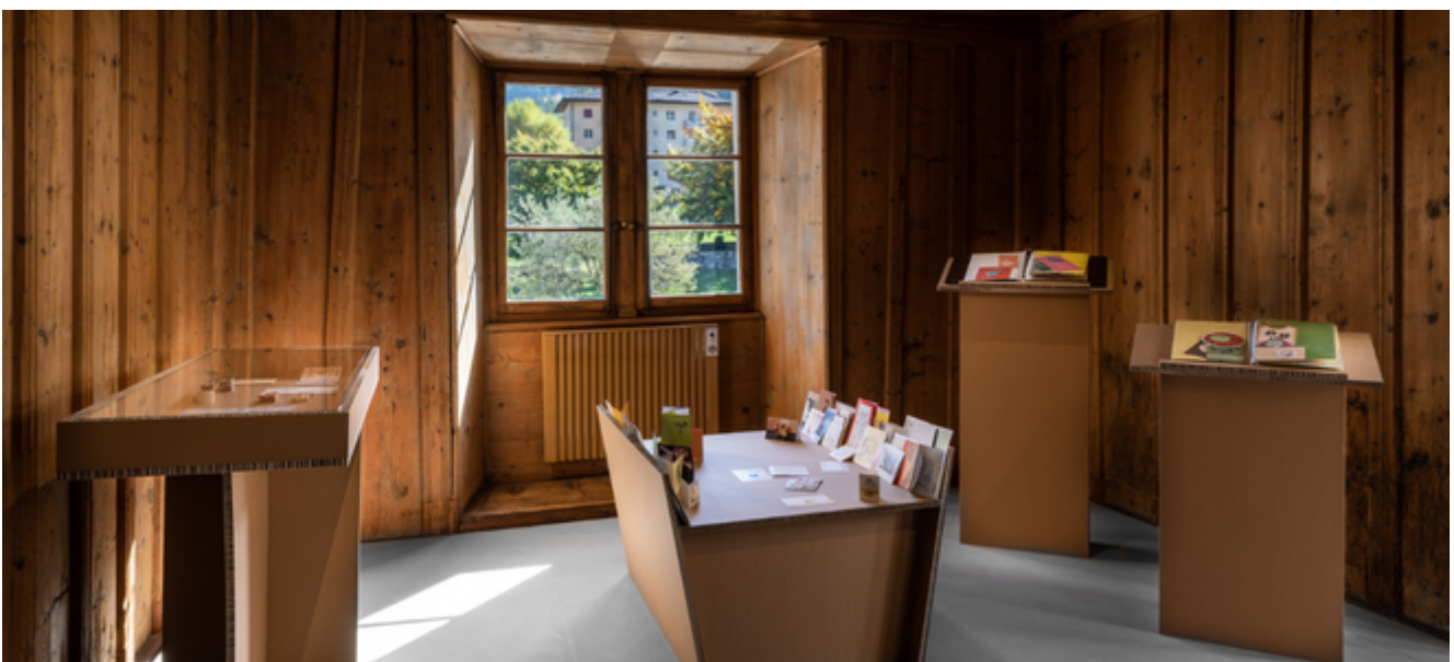
Musée sauvage, Musée de Bagnes

Instagram : @museescantonaux_kantonsmuseen