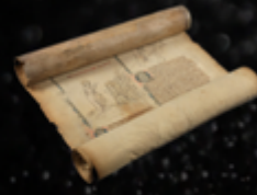
Le Livre sur le Manuscrit