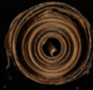
Parcourir le Manuscrit