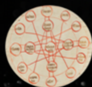
Histoire du Manuscrit