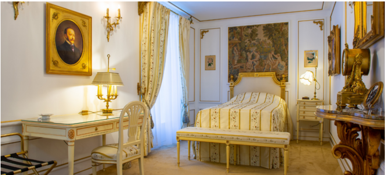
Suite de l'hôtel Ritz de Paris acquise par la Station Ritz, institution bénéficiant d'une aide financière en 2022