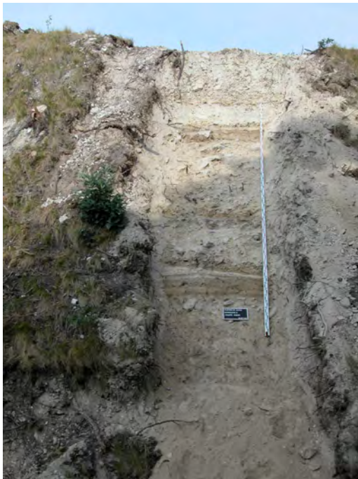
Fig. 2 – Sondage n° 6