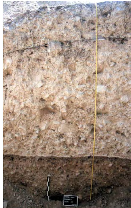
Fig.3 – Vue de la coupe est du sondage n°14