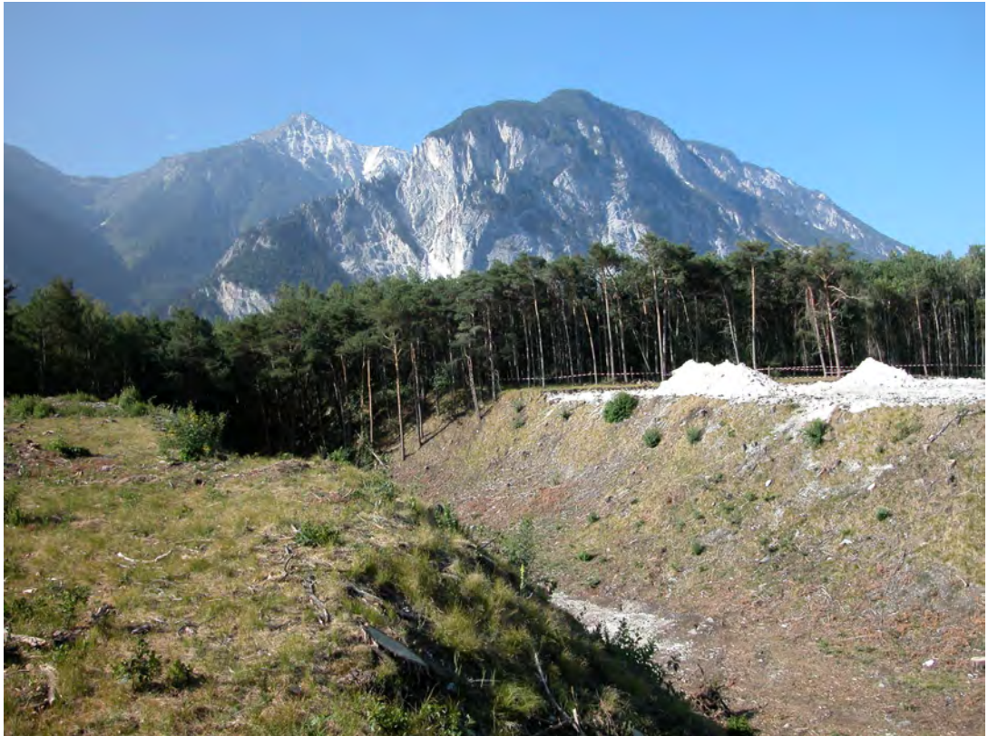
Fig. 1 – Vue du lit fossile de l’Illgraben