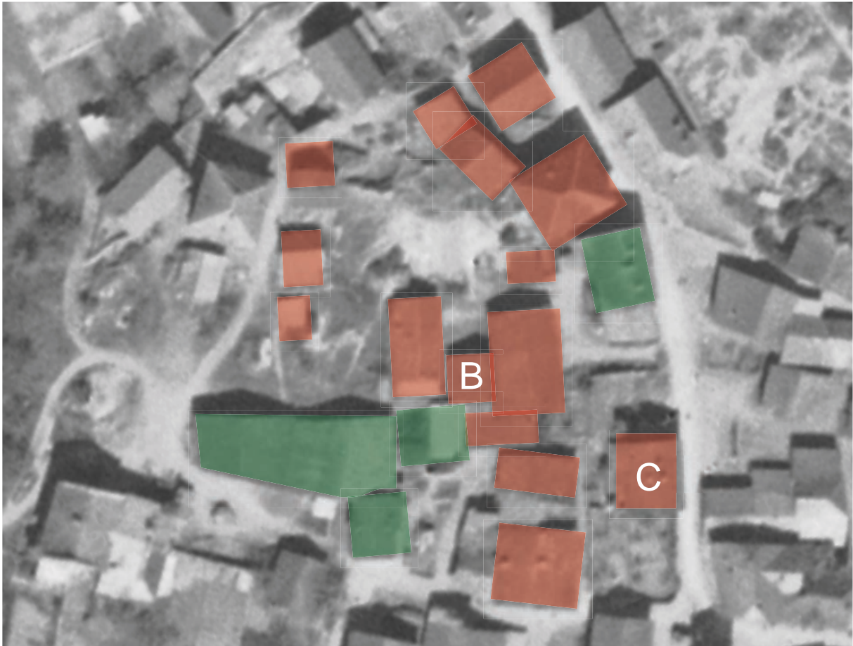
Fig. 5, Photographie aérienne du centre du village de Granges (zone de l'école) avec mise en contraste des bâtiments conservés et détruits, le bâtiment marqué d'un « B » blanc pourrait correspondre aux fondations observées en 1989, le bâtiment marqué d'un « C » blanc correspond à la cure, détruite vers 1946, antérieure à l' « ancienne cure » actuelle.