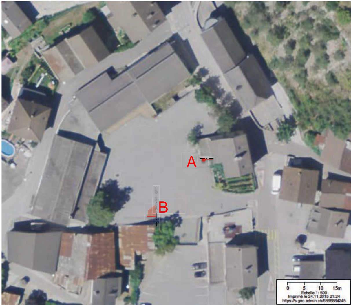
Fig. 1, Situation des découvertes d'août 1989, selon les documents photographiques de la Commission du Vieux-Granges.

Informations concernant les vestiges archéologiques recensés dans le centre du village de Granges.