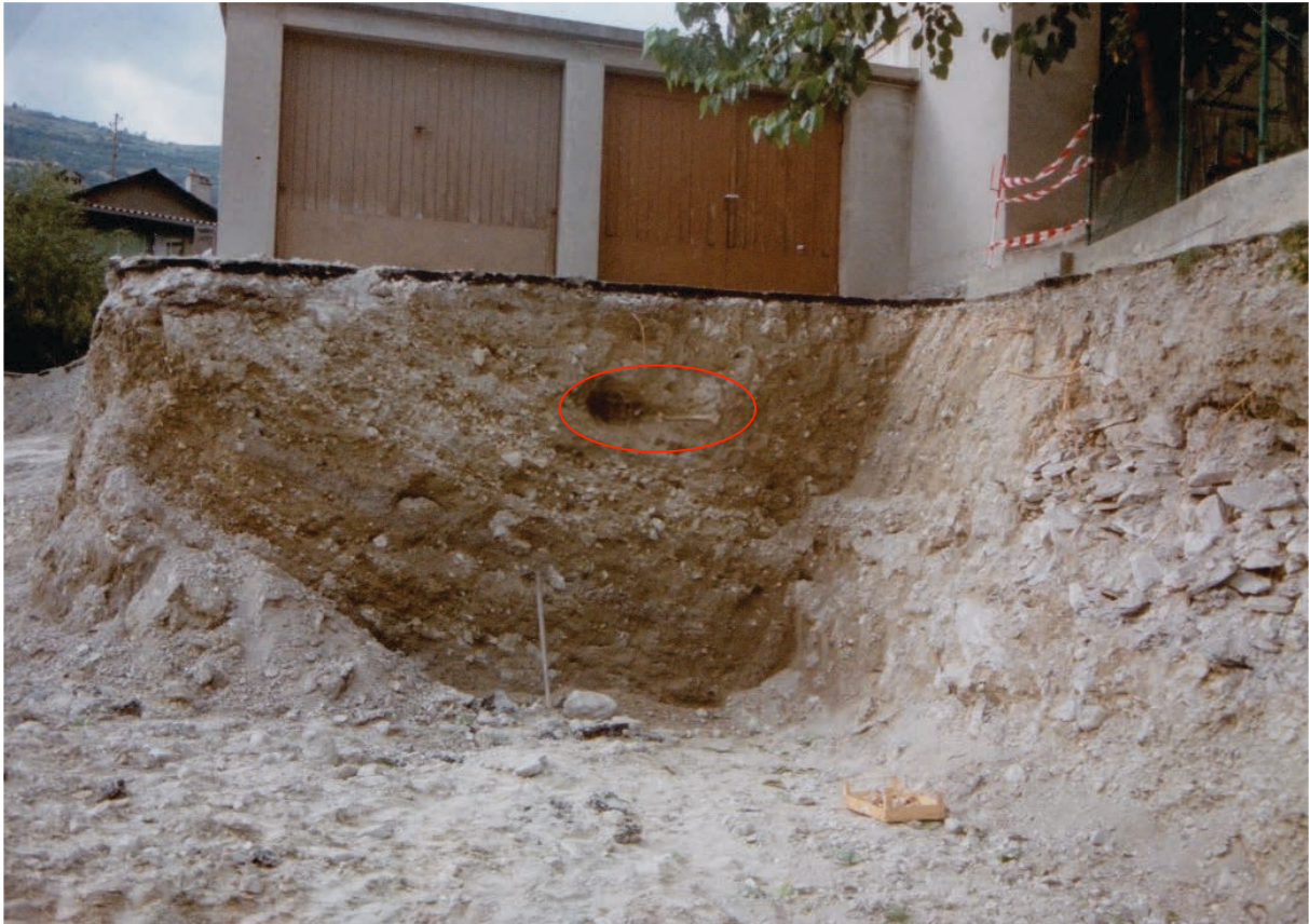
Fig. 2, Position de la tombe 1 dans le profil au pied des garages (Août 1989 Commission du Vieux-Granges).