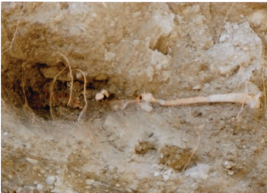
Fig. 3, Détail de la tombe 1, fémur, bassin et vertèbres (Août 1989 Commission du Vieux-Granges).