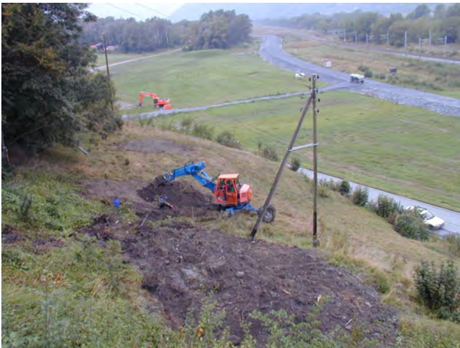
Fig. 3- Vue générale des sondages situés dans la pente à l'emplacement du portail sud du tunnel de Riedberg.