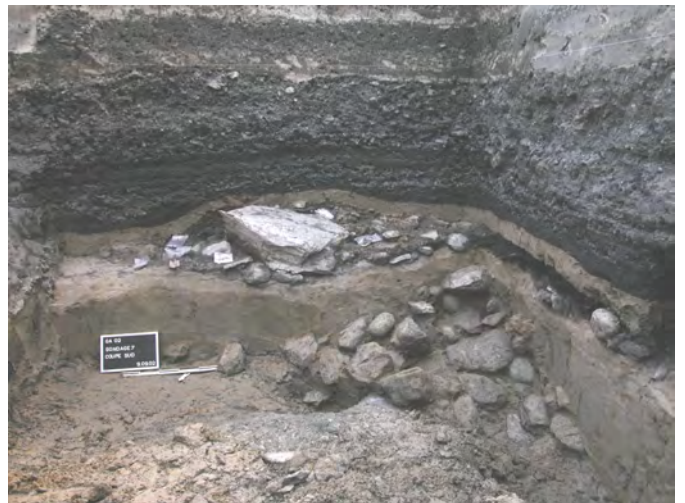
Fig. 2- Vue du sondage no 7 avec niveau de démolition d'un bâtiment maçonné. Le niveau de galets situé à la base du sondage correspond à un aménagement de berge fossile.