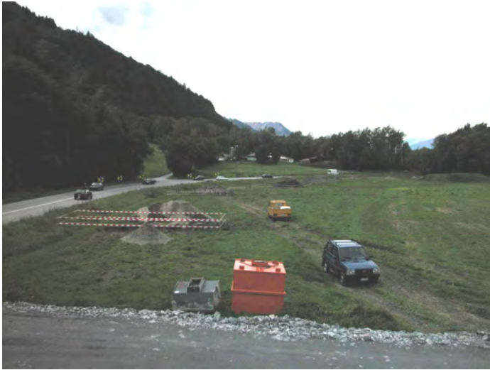
Fig. 1- Vue générale des sondages au niveau de la plaine du Rhône (Tännachra, rectification de la route cantonale)