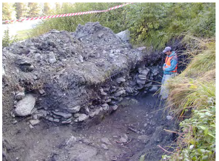
Fig. 4- Bâtiment semi-enterré en pierres sèches avec sol pavé.