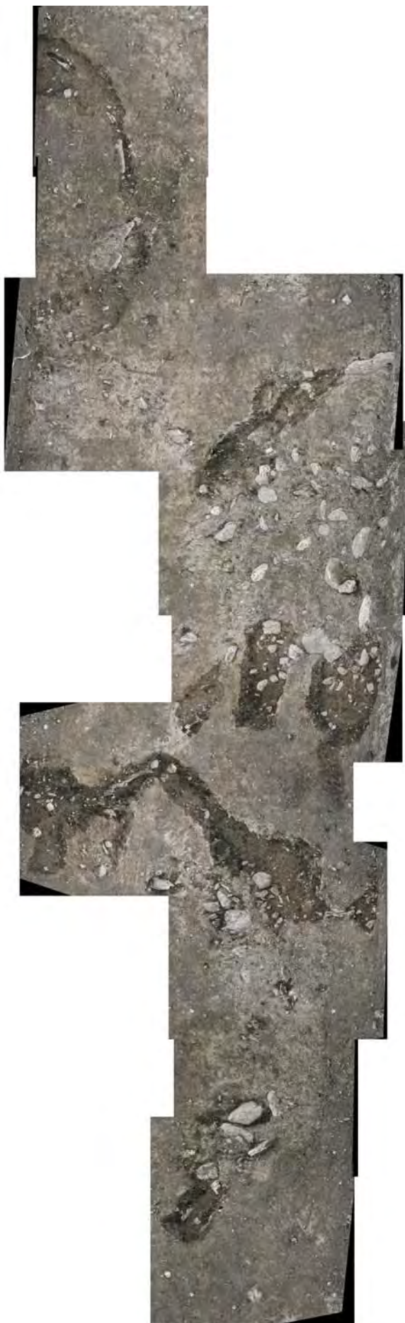
Figure 2 : Montage photographique de la partie nord dégagée de la tranchée de la route avec apparition des différentes structures tumulaires.