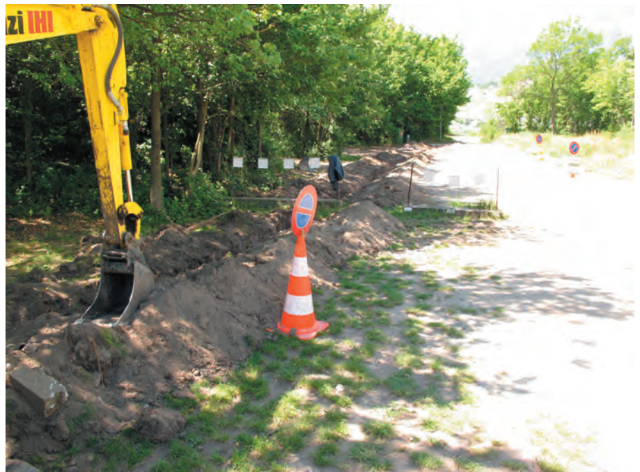
Fig. 2 Valère, En Prélet. Tranchée d'adduction d'eau vue vers l'ouest.