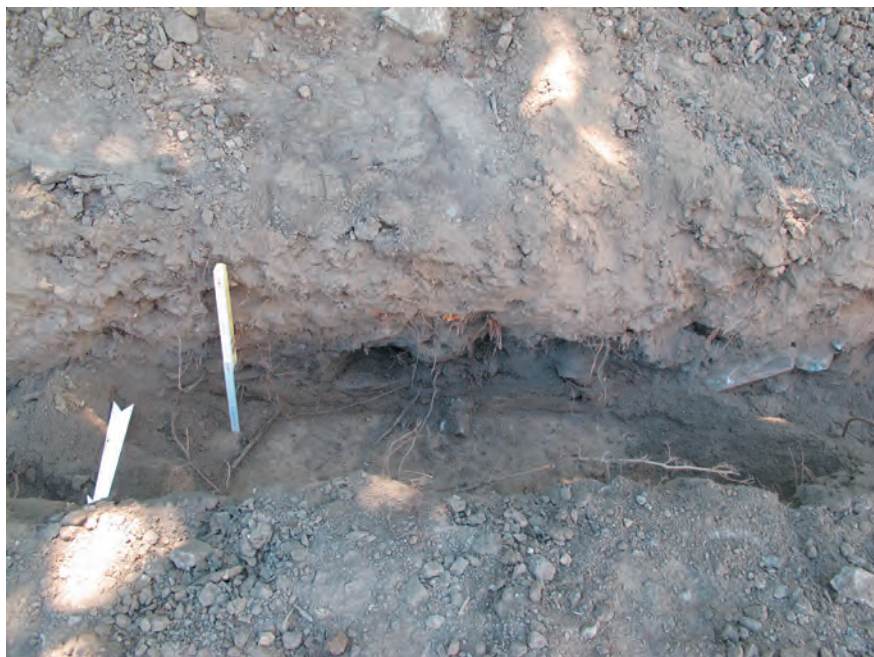
Fig. 3 Valère, En Prélet. Petite fosse à combustion (un foyer ?) repérée dans le profil sud de la tranchée grâce à son remplissage charbonneux et caillouteux.