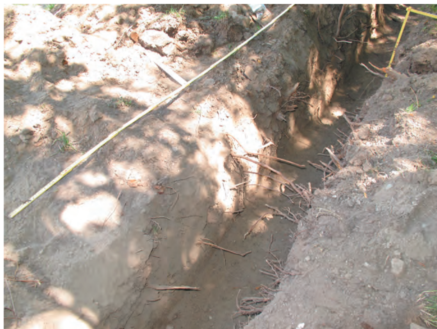
Fig. 4 Valère, En Prélet. Le niveau de l'âge du Bronze apparaît dans le profil de la tranchée, directement sous le niveau des racines. Il se distingue par une abondance de nodules de terre crue brûlée, des ossements (faune) et des tessons de céramique assez nombreux compte tenu de la faible surface explorée. Vue vers le nord-est.