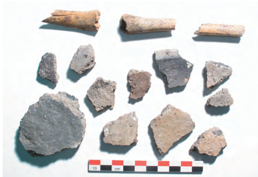
Fig. 5 Valère, En Prélet. Objets prélevés dans le niveau archéologique (Inventaire de Valère, Complexe no 1000com).