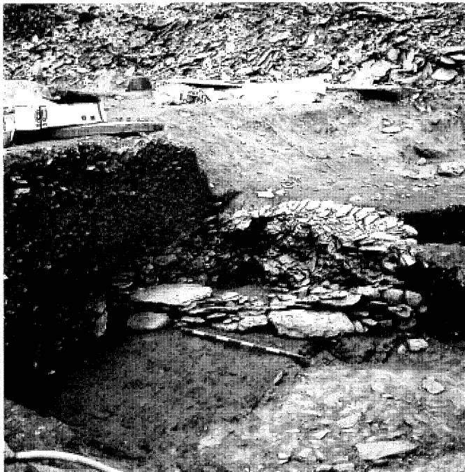
Cairn 1 en cours de fouille