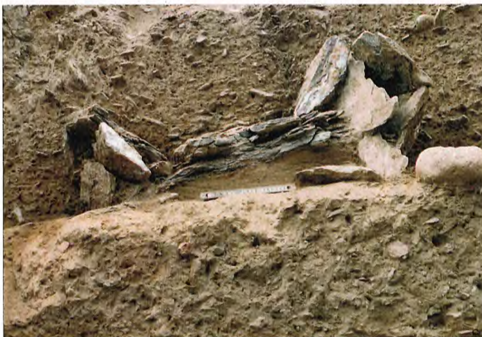
Profil Ouest; coupe à travers la tombe 1 après rectification du profil.

Cette découverte a motivé des fouilles d'urgence, conduites en fonction des impératifs chantier et en collaboration avec les responsables, à savoir le bureau d'architectes Proz-Pitteloud-Gubler en la personne de Mr Pitteloud, ainsi qu'avec les entreprises mandatées (VADI SA/Sion et ATRA/Ardon). Je tiens à relever ici l'excellent esprit dans lequel s'est faite cette collaboration et la compréhension dont ont fait preuve les responsables techniques par rapport aux impératifs archéologiques.