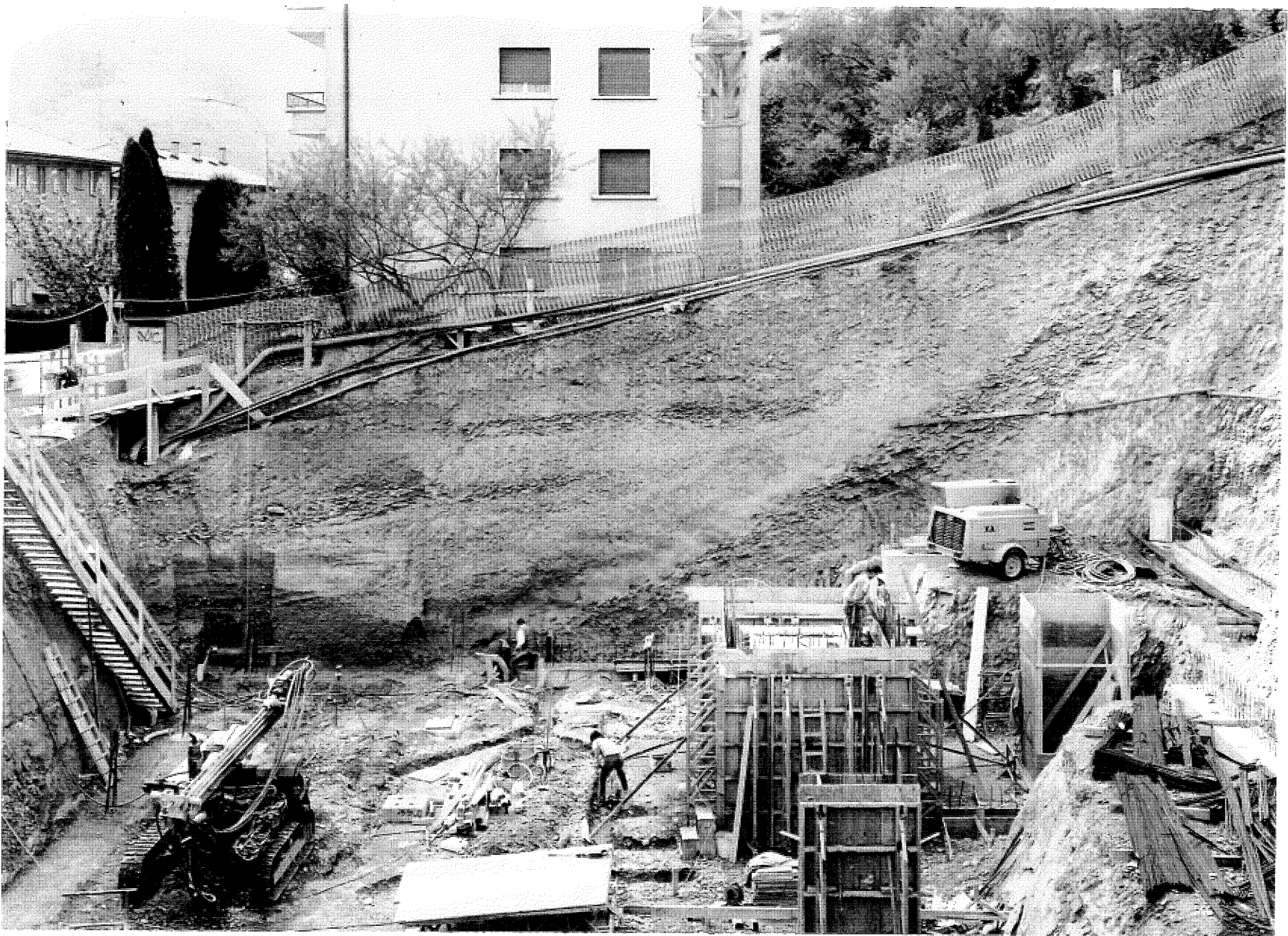
Profil Ouest de l'excavation