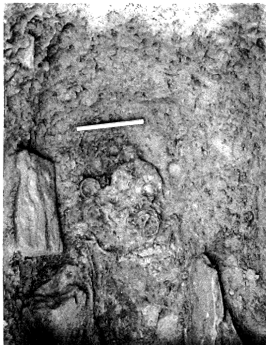
Tombe 3, détail; partie supérieure du squelette et mobilier