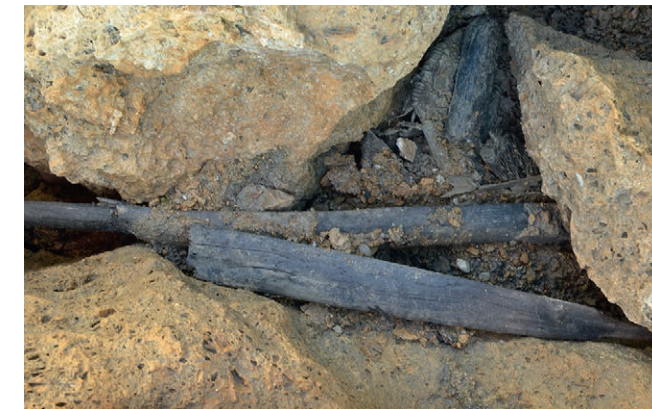
La boîte en bois de l'Âge du Bronze ancien et une partie de l'arc à leur emplacement de découverte entre deux grosses pierres.