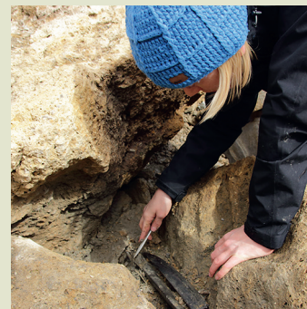
Une collaboratrice du Service archéologique du canton de Berne dégage un arc à flèche en orme qui sera daté de l'Âge du Bronze ancien.