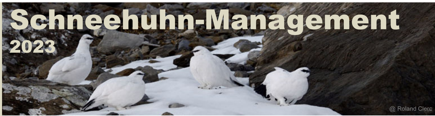
@ Roland Clerc