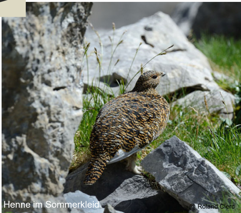
Henne im Sommerkleid

Anders als beim Birkhuhn sind Hahn und Henne beim Schneehuhn fast gleich aussehend. Der Hahn unterscheidet sich von der Henne lediglich durch die schwarzen Zügel zwischen Auge und Schnabel. Im Winter sind beide Geschlechter weiss und damit bei Schneelage optimal getarnt. Im Sommer ist der Hahn grau marmoriert und die Henne trägt ein gelbbraun gesprenkeltes Federkleid. Einzig die Flügel sind während des ganzen Jahres überwiegend weiss gefärbt.