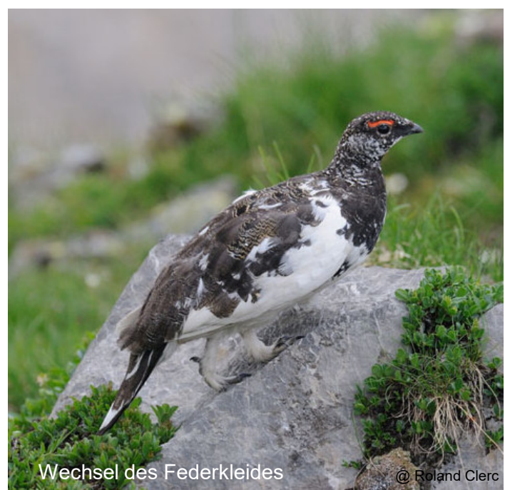
Wechsel des Federkleides

Beim Schneehuhn sind beide Geschlechter jagdbar, da eine optische Unterscheidung zwischen Hahn und Henne auf Distanz sehr schwierig ist. Im Wallis werden jährlich durchschnittlich ca. 110 Tiere erlegt. Die Jagd findet ausschliesslich im Herbst statt (Schonzeit gemäss Bundesgesetz vom 1. Dezember bis 15. Oktober). Der Einfluss der Jagd auf das Schneehuhn wurde bisher in der Schweiz nie wissenschaftlich untersucht. Die Jagdstrecke hängt oftmals auch von der Witterung ab, da bei frühem Schneefall im Herbst die Lebensräume der Schneehühner oftmals nicht mehr zugänglich sind. Entsprechend tiefer fällt die Jagdstrecke in solchen Jahren aus.