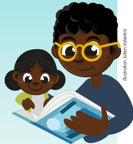
Illustration: Julien Valentini