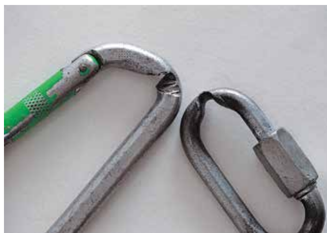
Remplacer immédiatement tout matériel usé

En droit, quiconque crée un état dangereux est tenu de prendre les précautions nécessaires et raisonnablement exigibles afin d'éviter tout dommage. Dans le cas d'un dommage, c'est en particulier la responsabilité du propriétaire de l'ouvrage qui est engagée: «Le propriétaire d'un bâtiment ou de tout autre ouvrage répond du dommage causé par des vices de construction ou par le défaut d'entretien.» [1] Il y a défaut lorsque la conception et le fonctionnement ne sont pas sûrs. La responsabilité du propriétaire de l'ouvrage est une responsabilité causale, c'est-à-dire indépendante de la faute. C'est pourquoi il est important de respecter les normes SN EN 12572 «Structures artificielles d'escalade». [2]