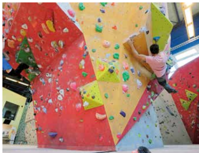
Kletterzentrum Milandia, Greifensee