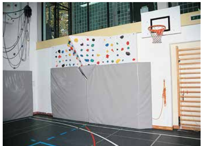
Mur d'escalade en bloc recouvert pendant les autres activités sportives en salle