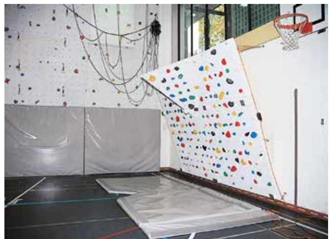
Même mur prêt à être escaladé