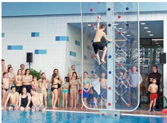
Mur d'escalade au bord d'un bassin de plongeon