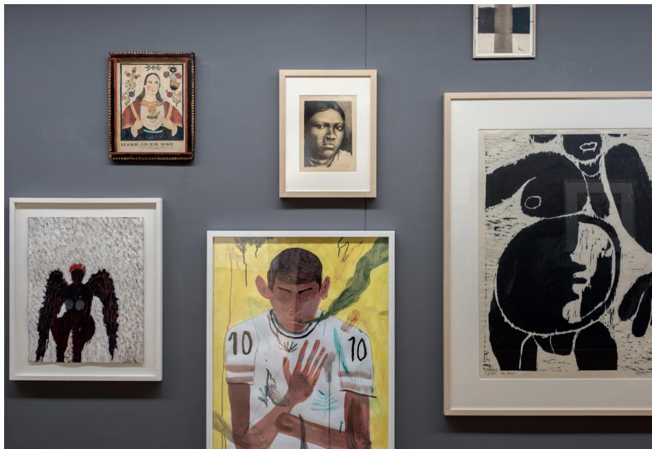
Fig. 6. My pleasure! Donations, etc. 2000-2020 , Sion, Musée d'art du Valais, 15 décembre 2020-7 novembre 2021.

mer en raison des mesures de lutte contre la pandémie. Un accrochage foisonnant présentera jusqu'à l'automne 2021 une large sélection des œuvres offertes à l'institution au cours des vingt dernières années, rendant ainsi hommage à de nombreux mécènes.