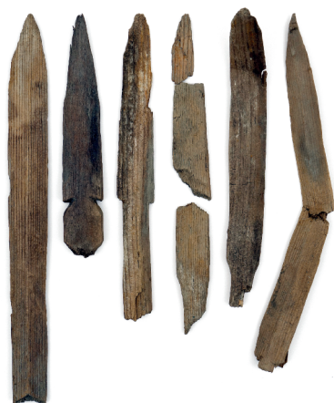
Fig. 8. Fragments de piquets de marquage en bois travaillé, découverts au col de la Forcle (commune de Chamoson) entre 2013 et 2018. Epoque romaine.

Le Musée d'histoire a complété ses fonds d'archéologie glaciaire.