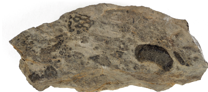
Fig. 13. Eponges fossiles, N576, prélevées au Sérac à Savièse par Stefan Ansermet.