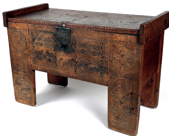
Fig. 9. Coffre en arolle à pieds montants, daté par dendrochronologie de 1468-1469. Les décors sont probablement récents, malgré la date de 1594.