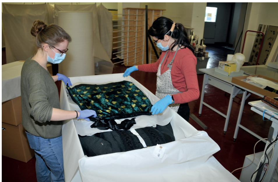
Fig. 1. Reconditionnement de la réserve textile.

collections, les Musées cantonaux disposeront, grâce à cette nouvelle réserve, d'un espace centralisé de compétence et de traitement. Digne du XXI e siècle, ce centre permettra aussi d'accueillir des groupes, notamment des classes ou des personnes à mobilité réduite, pour un accès «à la demande» aux patrimoines conservés. Afin de préparer ce déménagement de taille, un ambitieux chantier des collections a démarré en mars 2020 sous la direction de Romaine Syburra-Bertelletto, cheffe de la section Collections. Chaque objet ou spécimen y est traité, par des opérations de récolement, de complément d'inventaire, de photographie, de constat d'état, de stabilisation et de conditionnement. Aux collaborateurs internes mobilisés viennent prêter main-forte des chargés d'inventaire et des restaurateurs mandatés, des stagiaires en conservation-restauration et des civilistes.