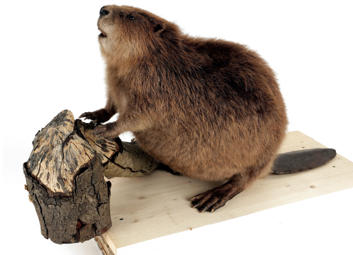
Fig. 16. Castor d'Europe, N611, Castor fiber , animal entier appuyé sur un tronc rongé par un castor. Naturalisé par Christopher Berclaz, Loc sur Sierre.