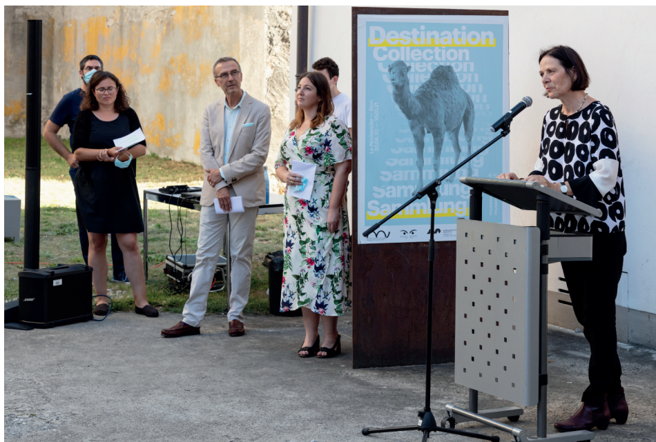
Fig. 4. Vernissage de l'exposition Destination Collection . Discours de M me la conseillère d'Etat Esther Waeber Kalbermatten.

La grande exposition Destination Collection , qui présentait le parcours d'objets provenant de musées de tout le canton, s'est ouverte le 20 juin ; le vernissage, repoussé au 21 août, a réuni les responsables et collaborateurs des quelque 40 musées participants. Après un montage perturbé par la pandémie de covid 19, son exploitation a souffert des mesures sanitaires (fréquentation, dispositifs tactiles, journées de médiation, etc.).