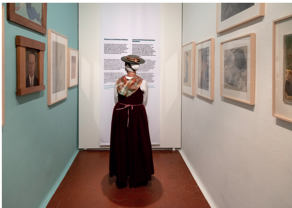
Fig. 5. Vernissage de l'exposition Destination Collection . Vue d'une cellule du Pénitencier.

d'être des musées à travers des objets dûment sélectionnés pour leur représentativité. Le millier d'objets présentés (objets historiques et ethnographiques, objets et œuvres d'art, spécimens naturels, etc.) témoignait d'une richesse et d'une diversité inattendues, qui montraient le patrimoine mobilier conservé en Valais sous une lumière nouvelle et des perspectives inédites. La participation des visiteurs interpellés par des questions simples sur les objets et les musées a concouru à son succès auprès des publics. Malmenée par les conditions sanitaires, Destination Collection a été prolongée jusqu'au 30 mai 2021.