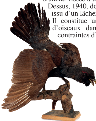
Fig. 14. Grand tétras, N590, Tetrao urogallus , issu d'une réintroduction dans la région de Martigny, naturalisé en 1940.