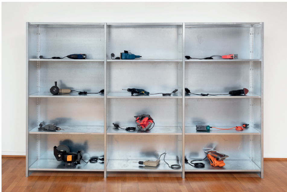
Fig. 3. Delphine Reist, Etagère .

(© Musées cantonaux du Valais, Sion. Photo: Michel Martinez)