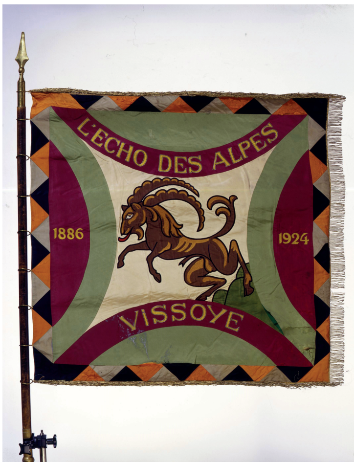
Fig. 10. Drapeau Art déco de la fanfare de Vissoie, l’Echo des Alpes, dessiné par Edmond Bille et réalisé par les sœurs du monastère de Géronde, 1924.

(© Musées cantonaux du Valais, Sion. Photo : Heinz Preisig)