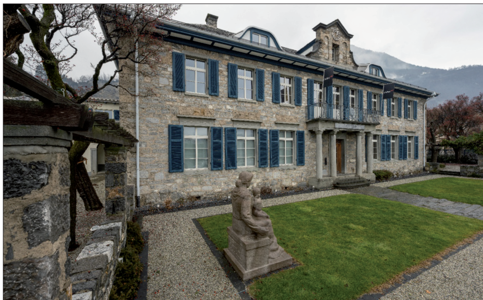
Fig. 2. Sierre, foyer Alusuisse.