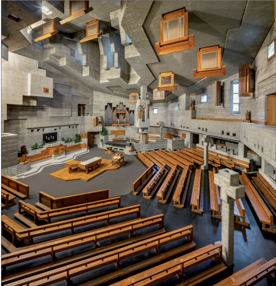
Fig. 4a à 4f. Hérémence, église Saint-Nicolas.