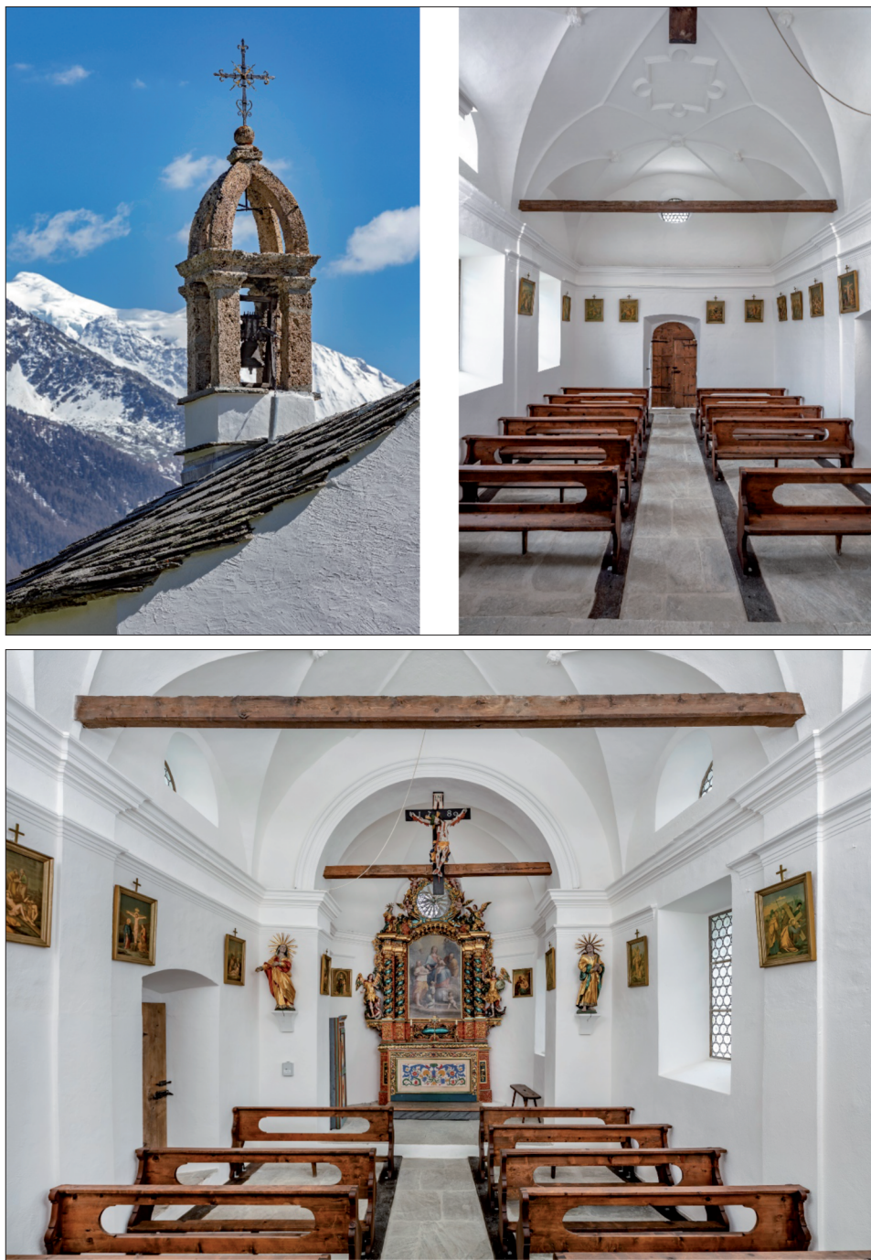
Fig. 7a, 7b et 7c. Törbel, chapelle Feld.