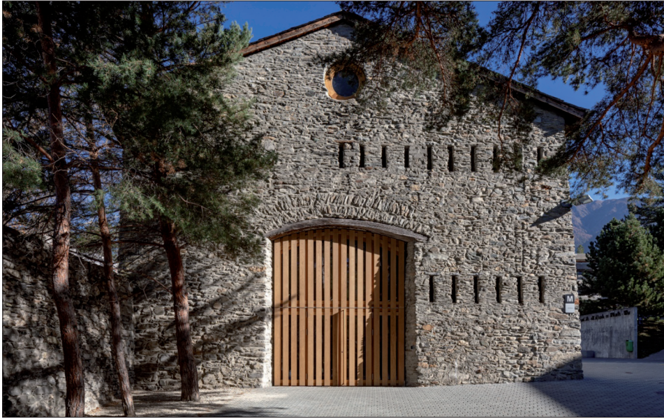
Fig. 5. Brigue, collège jésuite, grange et murs d'enceinte.