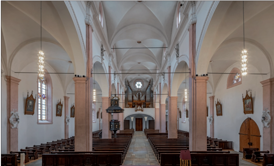
Fig. 6. Glis, Wallfahrtskirche.