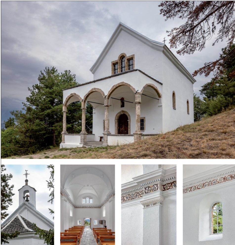
Fig. 8a à 8e. Ried-Brigue, Brigerberg, chapelle Burgspitz.