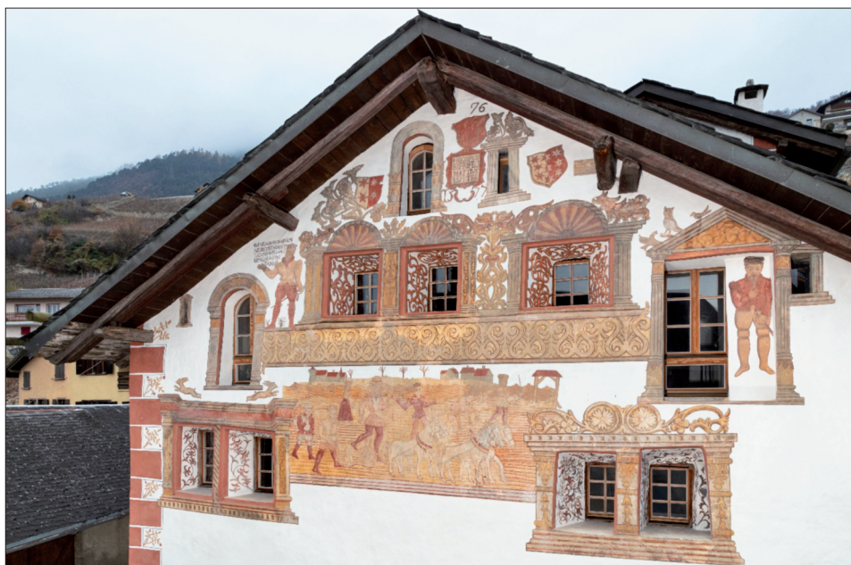
Fig. 3. Lens, maison peinte de Vaas.