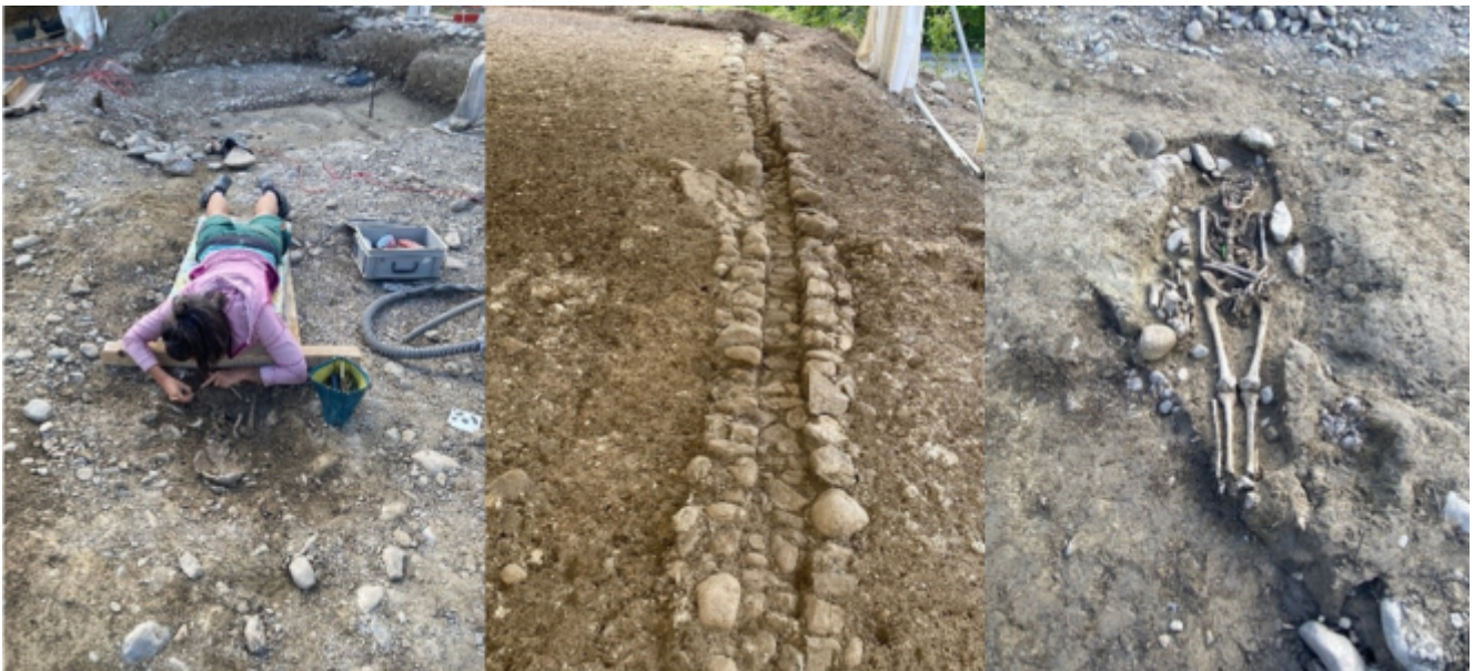
Instantanés des fouilles de l'église Saint-Laurent, été 2023.

Informations pratiques et carte sur www.cafedevalere.ch .