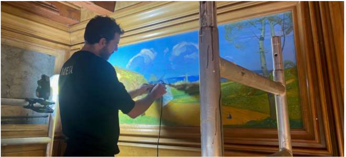
Intervention de consolidation, salle à manger Château Mercier