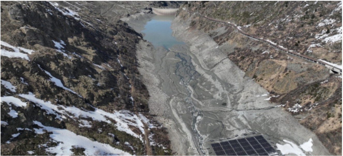
Projet de parc solaire et barrage du lac des Toules