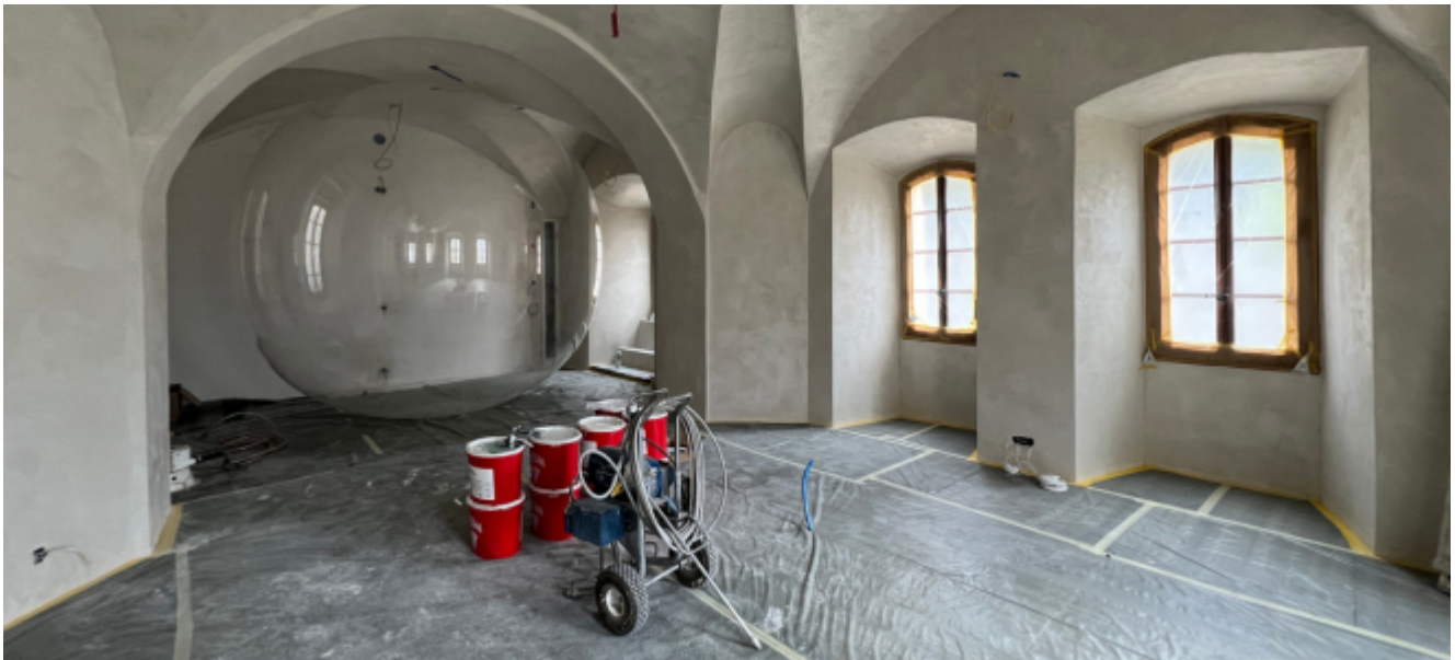
Montage de l'exposition de Lang/Baumann dans l'Ancienne Chancellerie, août 2024