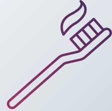
Hygieneartikel Seife, Unterwäsche, Zahnbürste, ...