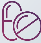
Medikamente und Erste-Hilfe-Material