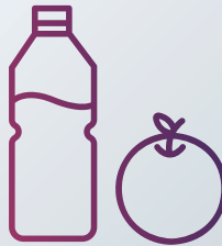
Verpflegung für 1 Tag, Wasser, Lebensmittel