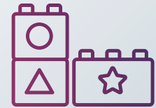
Spielzeug für Kinder