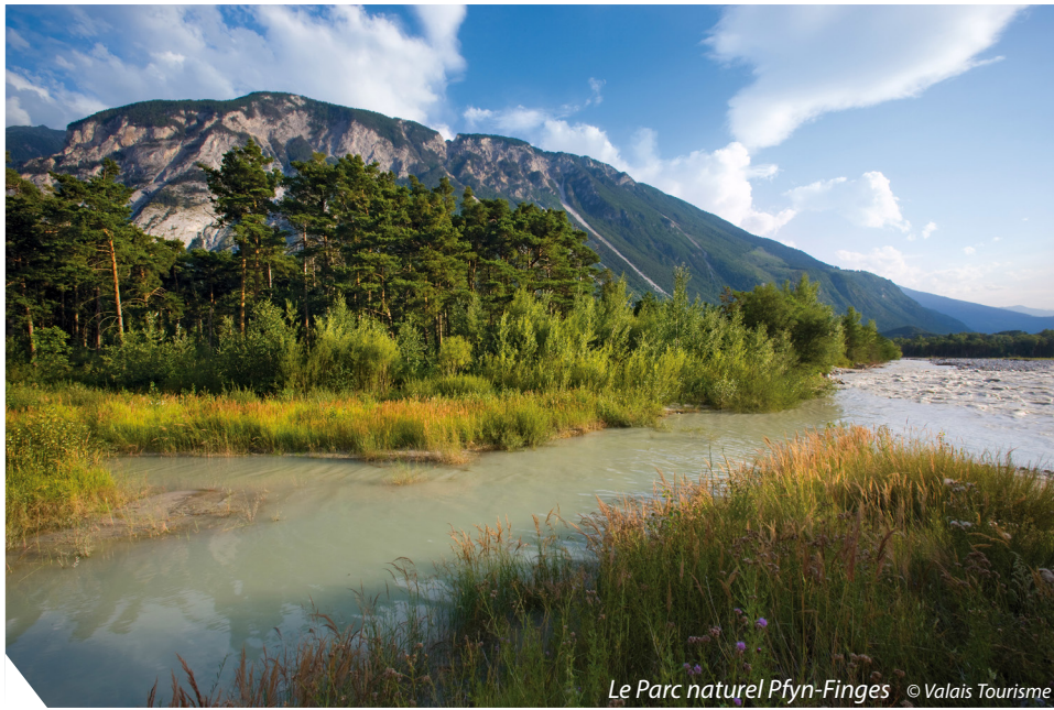
Le Parc naturel Pfyn-Finges

Vallée où le Rhône a son cours, Noble pays de mes amours, C'est toi, c'est toi, mon beau Valais ! Reste à jamais, reste à jamais, reste mes amours !