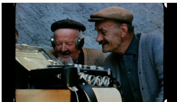
Image tirée du film Un village du val de Bagnes, Bruson , réalisé par Jean-Jacques Honegger en 1978