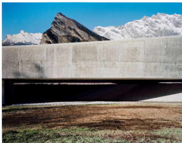
Nicolas Faure (* 1949 ), Pont de Riddes , de la série Paysages A. , 12.1997 ( tirage de 2012 ), tirage photographique encollé sur aluminium, 125 x 160 cm, Musée d'art du Valais ( BA 3268 ).