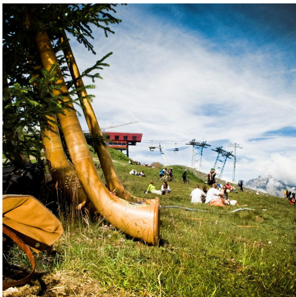
Là-haut sur la montagne , 2014 © Delphine Claret-Broggio, EQ2