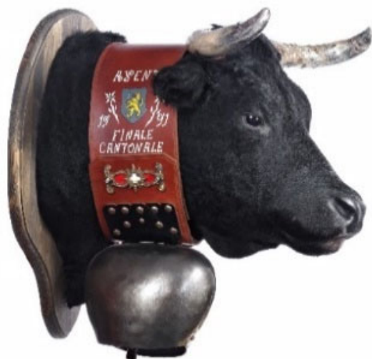
Tête de vache taxidermée et cloche, entre 1991 et 2007 Collections du Musée d'histoire du Valais, MV 11646