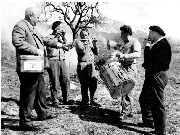
Reportage de Radio-Lausanne lors d'une journée de vignolage au-dessus de Sierre, 1967. A droite de l'image, le compositeur Jean Daetwyler.