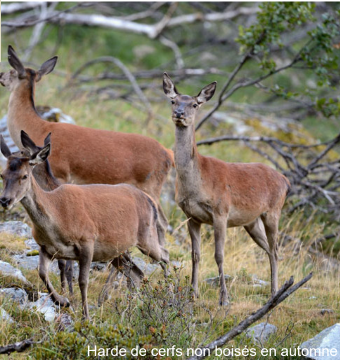
Hardes de cerfs non boisés en automne

Dans les régions enneigées du Valais, le cerf élaphe migre chaque année des remises d'été en altitude vers les remises d'hiver situées plus bas. Le cerf élaphe se concentre alors souvent dans quelques remises d'hiver appropriées, en particulier sur des pentes ensoleillées exposées au sud avec des prairies où la neige fond rapidement, et dans les forêts protectrices.