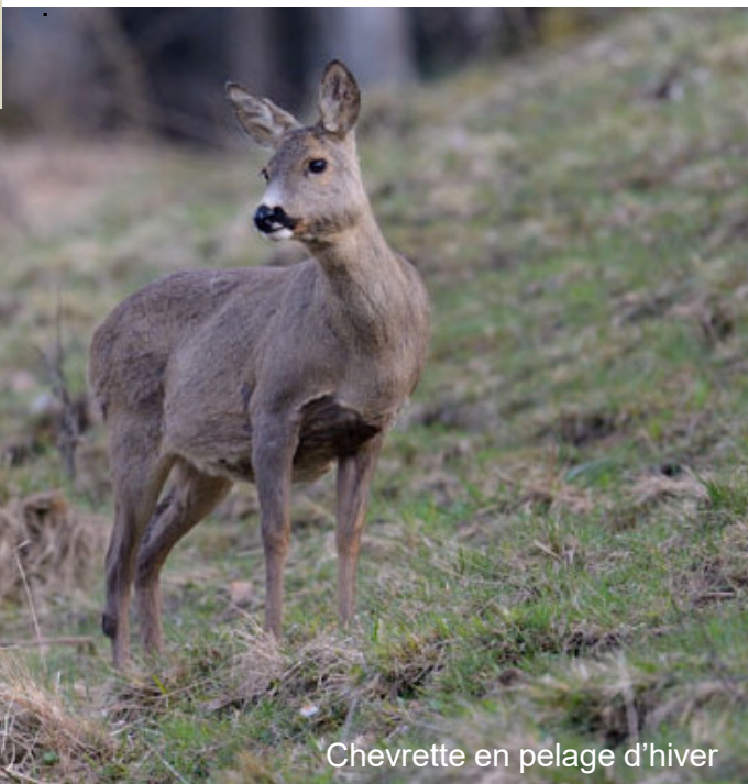
Chevrette en pelage d'hiver

Le chevreuil n'est pas un coureur endurant, mais en cas de danger il se glisse à couvert. Son arrière-train surélevé est parfaitement adapté à ce comportement. Une caractéristique propre au chevreuil: lorsqu'il est poursuivi, il tente de se défaire de son poursuivant en fuyant en zigzag et en revenant sur ses pas en sautant.